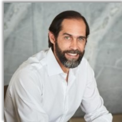
VP Grupo Hilasal, Presidente Junta de ADOC, Director de FUNDEMAS, Director de ¡Supérate!”