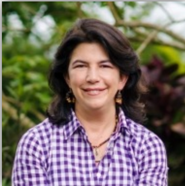
CEO de CISA Exportadora y fundadora de “Operación Sonrisa”