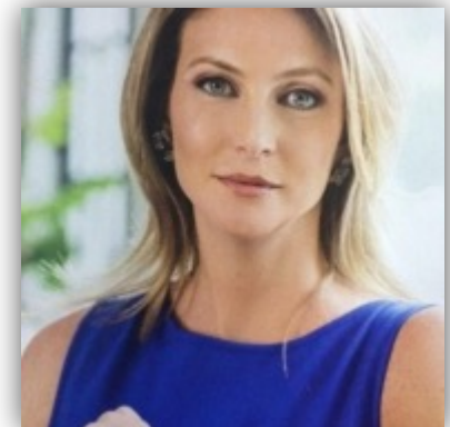
Productora de “Héroes por Panamá” y CALI fellow.