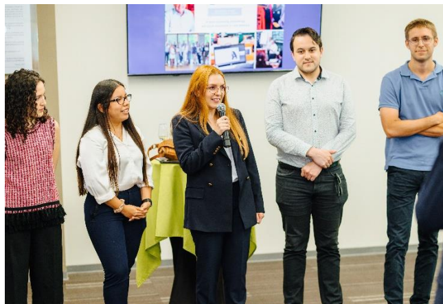
Ilustración 7. Becarios de la primera generación de la Cátedra Strachan durante la celebración del décimo aniversario