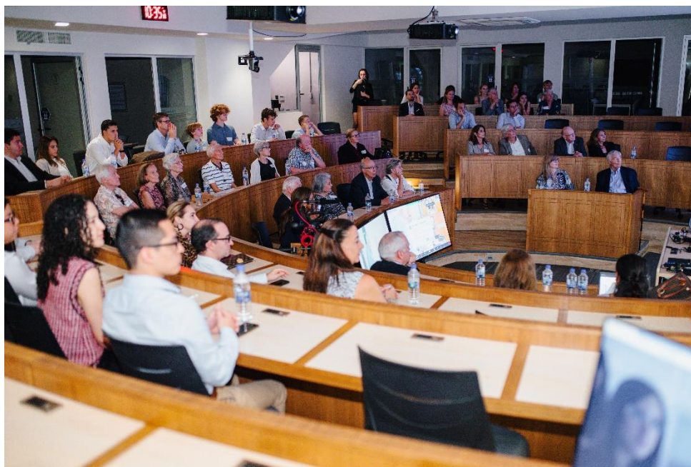
Ilustración 5. Audiencia en la sesión magistral de presentación de resultados