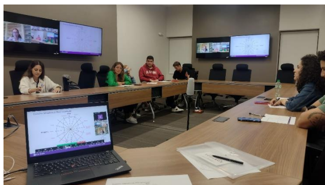
Ilustración 14. Actividades de seguimiento sobre temas para la búsqueda de propósito